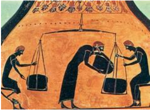
Εικόνα από αγγείο του 6ου αιώνα π.Χ. (Νέα Υόρκη, Μητροπολιτικό Μουσείο).